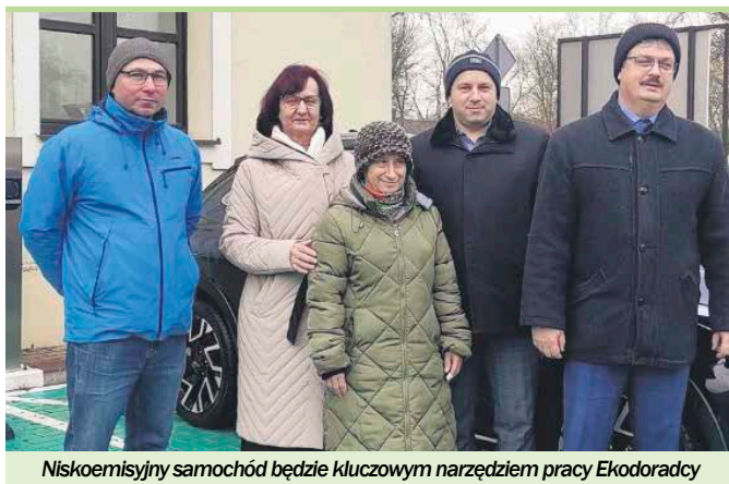
Niskoemisyjny samochód będzie kluczowym narzędziem pracy Ekodoradcy

Projekt „Mazowsze bez Smogu” jest ambitną inicjatywą, której liderem jest Urząd Mar-