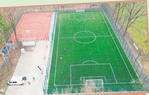
Obiekt zyskał standardy, które spełnią oczekiwania zarówno młodych sportowców, jak i rekreacyjnych użytkowników.

Zmodernizowany Orlik przy Stawowej jest gotowy na przyjęcie użytkow-