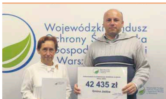
Pozyskana kwota stanowi istotny zastrzyk finansowy dla projektu modernizacji.