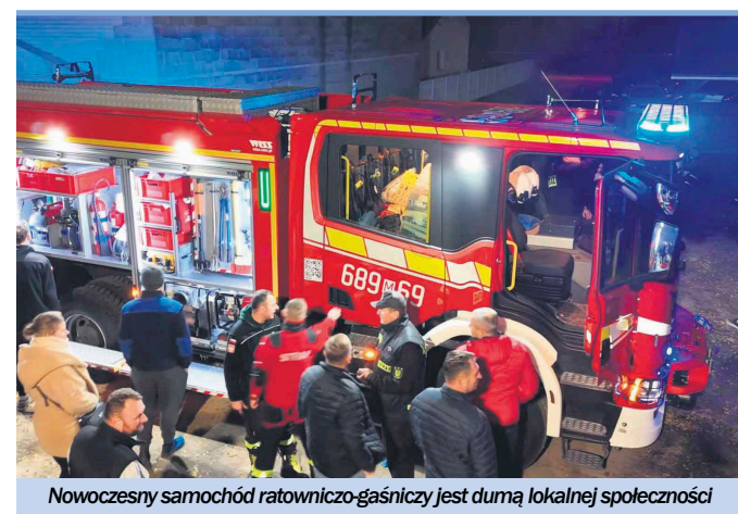
Nowoczesny samochód ratowniczo-gaśniczy jest dumą lokalnej społeczności

- To był wyjątkowy dzień i wieczór nie tylko dla strażaków, ale