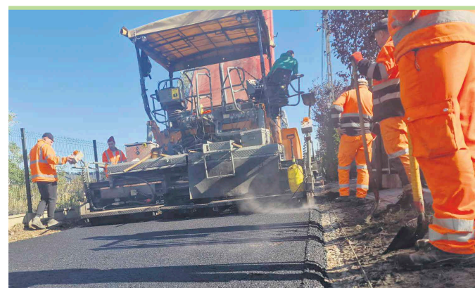
Przebudow dróg gruntowych na asfaltowe przebiega w szybkim tempie.

Modernizacja dróg w Markach trwa nadal. 16 października ułożono pierwszą, wiążącą warstwę asfaltu na ulicach Bandurskiego 55 oraz Kamienieckiej. Są to kolejne miejsca, gdzie lokalna infrastruktura drogowa przechodzi