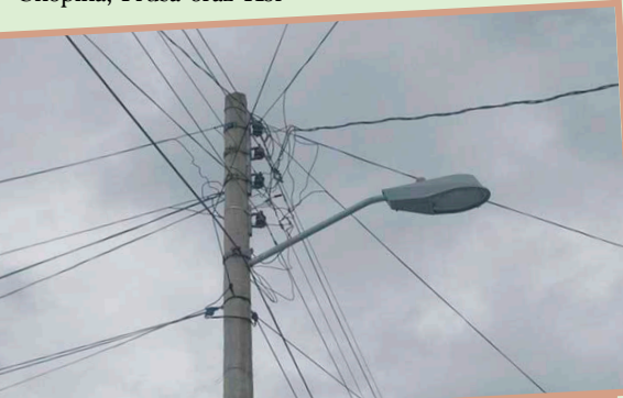
Władze Kobyłki apelują do mieszkańców o zgłaszanie wszelkich problemów i wyrozumiałość w przypadkach, gdy naprawy wymagają więcej czasu.

działań i bardziej zaawansowanych interwencji. Miasto zapewnia, że wszelkie działania są podejmowane natychmiast po zgłoszeniu i że każda usterka, bez względu na swoją złożoność, jest sukcesywnie usuwana.