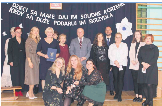
Obchody w ZSP Urle były okazją do wyrażenia wdzięczności pracownikom szkoły

– Nauczyciel to osoba, która jest nie tylko fachowcem w swojej dziedzinie, ale także jest sprawnym pedagogiem i psychologiem, wychowawcą nie tylko swoich uczniów, ale bardzo często osobą pomocną także ich rodzicom. Jak mało kto potrafi sprostać rosnącym z roku na rok wymaganiom, zwiększającej się ilości obowiązków, rosnącym potrzebom szkoły i uczniów. Jest osobą stale doskonalącą się, powiększającą zasób