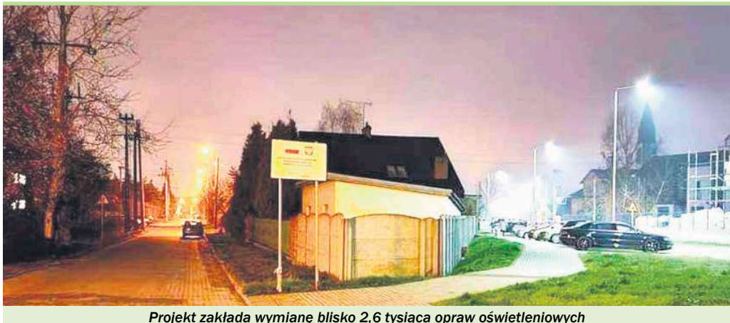
Projekt zakłada wymianę blisko 2,6 tysiąca opraw oświetleniowych

Oprócz aspektów finansowych, kluczowymi kryteriami, które zdecydowały o wyborze oferty, są cena oraz okres gwarancji i rękojmi, który powinien wynosić od pięciu do dziesięciu lat. Długoterminowa gwarancja jest niezbędna, aby zapewnić trwałość i niezawodność nowo instalowanych opraw. Przetarg zapewnia konkurencyjność procesu, dzięki czemu miasto ma nadzieję na uzyskanie najkorzystniejszej oferty.