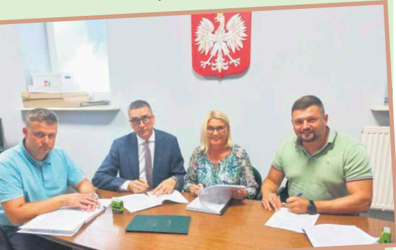
Odpowiednie oświetlenie przejść jest szczególnie istotne w sezonie jesienno-zimowym, kiedy szybko zapada zmrok.

Doświetlenie przejść dla pieszych na ulicy Mareckiej to kolejny etap programu, który sukcesywnie realizowany jest w Zielonce. Do tej pory zainstalowano już 38 takich nowoczesnych doświetleń w całym mieście. Teraz przyszła pora na ulice Marecką, gdzie do