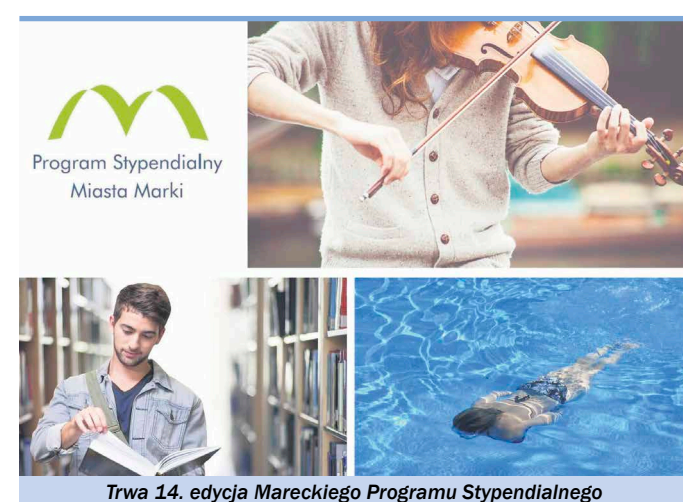
Trwa 14. edycja Mareckiego Programu Stypendialnego

Do zdobycia jest dziesięć stypendiów dla uczniów szkół ponadpodstawowych oraz dwadzieścia dla studentów. Pro-