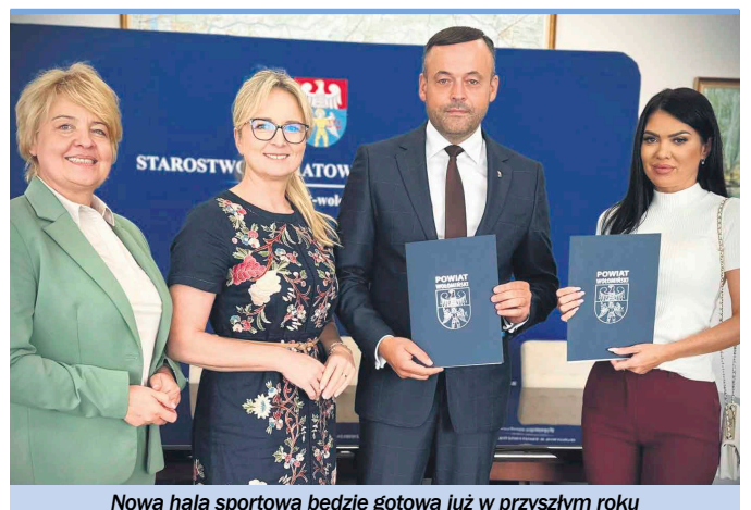
Nowa hala sportowa będzie gotowa już w przyszłym roku

Planowana hala sportowa, o powierzchni 1651,12 m 2 i wysokości 12,60 metra, będzie miała jedną naddzielną kondygnację i będzie połączona zadaszonym łącznikiem z głównym budynkiem szkolnym. Dzięki temu uczniowie zyskają łatwy i szybki dostęp do obiektu