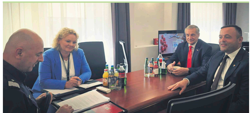
Podczas spotkania zaprezentowano wstępną koncepcję budowy nowego komisariatu.

– Jest to niezwykle ważny projekt dla naszego powiatu, a samorządy lokalne są w pełni zaangażowane w jego realizację – podkreślają przedstawiciele władz lokalnych.