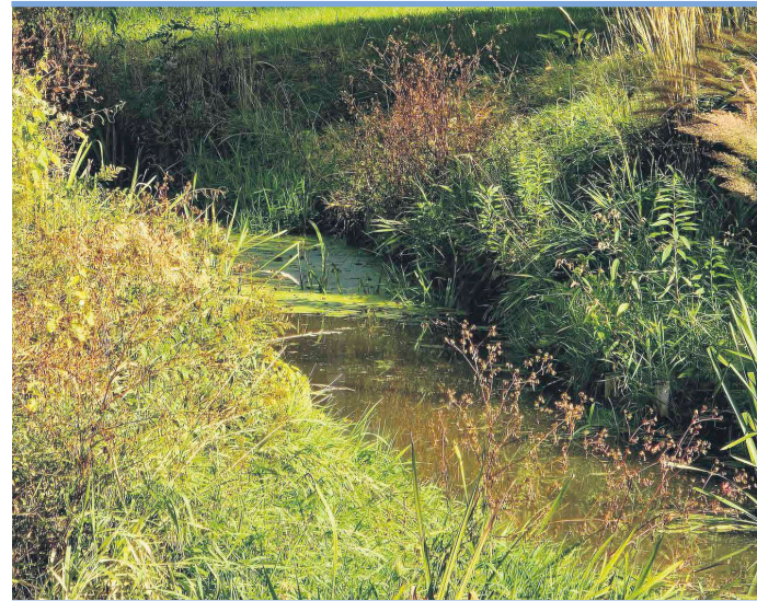
Rejon zlewni rzeki Czarna Struga jest szczególnie narażony na występowanie lokalnych podtopień w przypadku zwiększonych opadów deszczu.