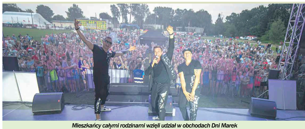
Mieszkańcy całymi rodzinami wzięli udział w obchodach Dni Marek

Nie mogło oczywiście zabraknąć atrakcji dla najmłodszego