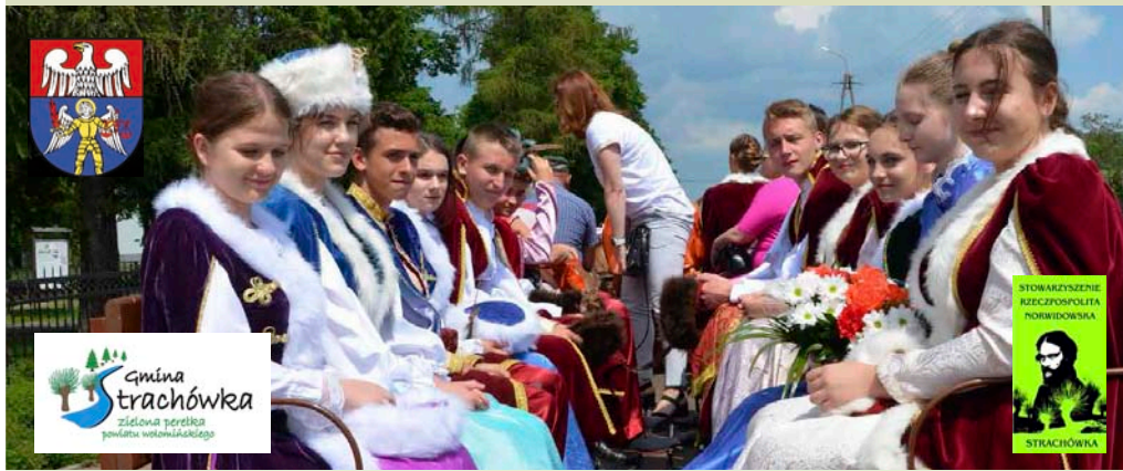
Po raz piątnasty 2 czerwca 2019 r. ze Strachówki wyruszył korowód weselny rodziców Cypriana Norwida