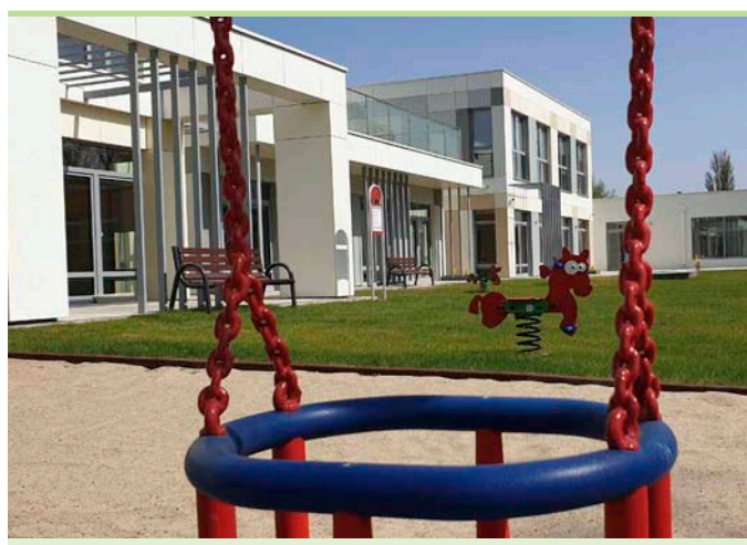
Nowa część przedszkola jest w stanie przyjąć 225 dzieci

Otwarcie przedszkola jest znakomitą wiadomością dla miasta, do którego stale napływają nowi, głównie młodzi mieszkańcy. Według danych Głównego Urzędu