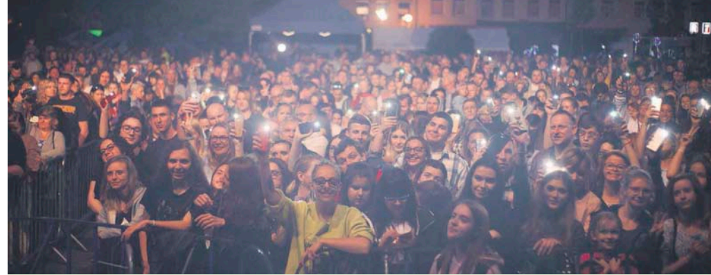
Pelen wrażeń dzień miał swój muzyczny finał, który zgromadził tłumy publiczności.

W obchody Dni Wołomina włączyły się również lokalne organizacje pozarządowe. Stowarzyszenie „Czas na lepsze”, we współpracy z Urzędem Miejskim uzyskało z budżetu województwa mazowieckiego dofinansowanie w ramach konkursu „Propagowanie idei Sieci Dziedzictwa Kulinarnego Mazowsza oraz upowszechnienie produktów tradycyjnych, regionalnych i lokalnych”. Dzięki uzyskanym środkom odbyły się interesujące warsztaty zielarskie, pszczelarzkie, ekologiczne