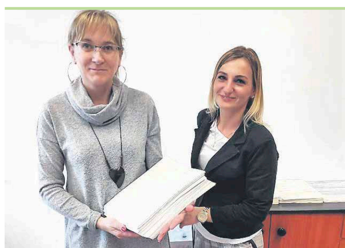
Dzięki nowej usłudze TAX-i pracownik Urzędu Miasta przyjdzie do mieszkańca

Zgłoszenie pod numer 22 760 70 08. I wtedy Urząd przyjdzie do mieszkańca, a nie mieszkaniec do urzędu. To nowa usługa: TAX-i, która jest dostępna do 21.00 w dni powszednie. Formularz można podpisać w urzędowym samochodzie lub u siebie w domu. Trzeba mieć przy sobie dowód osobisty.