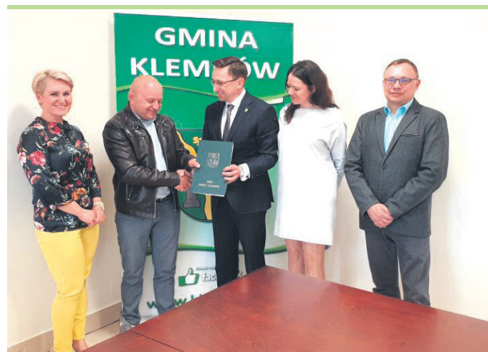
Mieszkańcy będą mogli skorzystać z nowo wybudowanej drogi już tym roku.