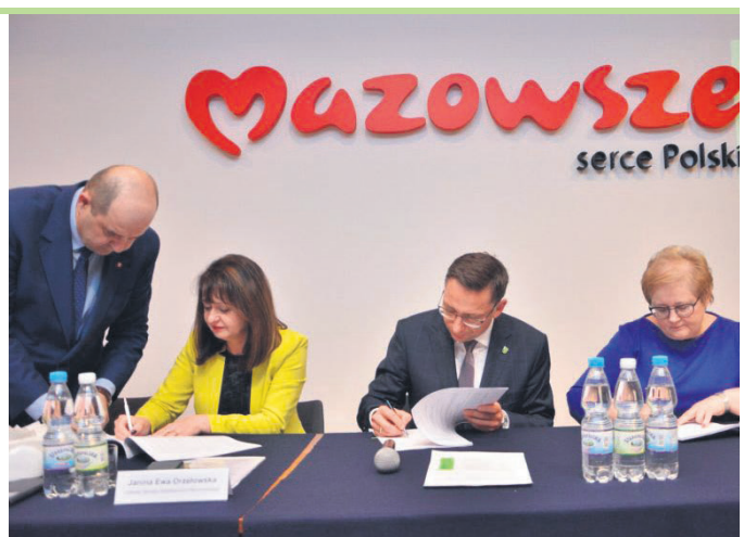
Już niebawem rozpocznie się rozbudowa szkoły w Dobczyń

Dofinansowanie w wysokości nie przekraczającej kwoty 885 724,00 zł pochodzi ze środków Europejskiego Funduszu Rolnego na rzecz Rozwoju Obszarów Wiejskich w ramach Programu Rozwoju Obszarów Wiejskich na lata 2014–2020.