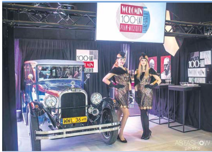
Na stoisku Wołomina uwagę zwracał zabytkowy samochód, hostessy wystylizowane na lata 20-te i odpowiedni dla epoki anturaz.