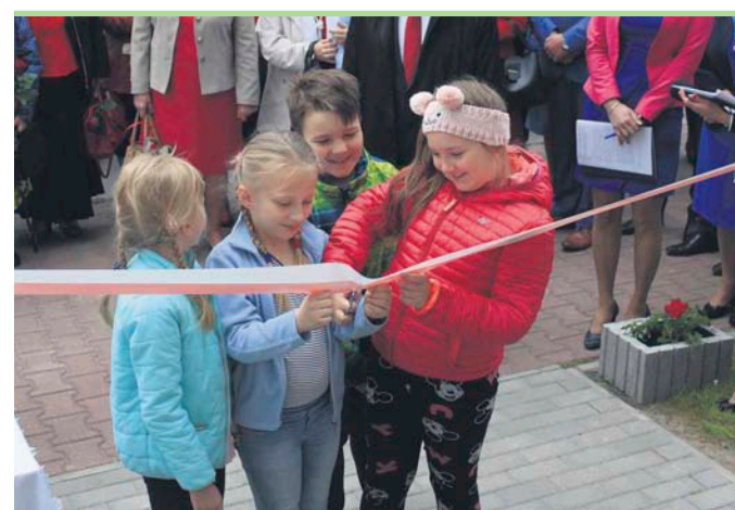
Do przecięcia symbolicznej wstęgi zaproszono najmłodszych czytelników

Prowadzone etapowo roboty budowlane polegały na rozbudowie i przebudowie wraz ze zmianą sposobu użytkowania budynku o powierzchni użytkowej ponad 643,20m 2 , w którym dotychczas siedzibę miała biblioteka oraz mieścił się ośrodek zdrowia. W efekcie realizacji projektu biblioteka dysponuje czterema pomieszczeniami przeznaczonymi na księgozbiór, wypożyczalnią, czytelnią połączoną z salą komputerową, świetlicą, salą konferencyjną, pomieszczeniami gospodarczymi i socjalnymi. Ponadto w budynku funkcjonować będą również Gminny Ośrodek Pomocy Społecznej oraz Archiwum Urzędu